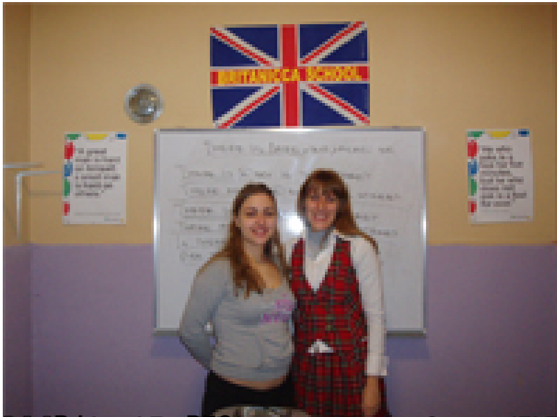
Priprema za IELTS ispit