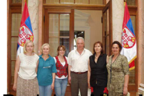
Projekat Hotel Slavija