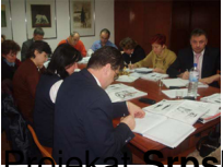
Projekat Evropski Demokratski Forum